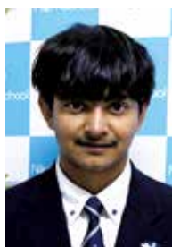
カナルキルタン (象潟中学校出身)

高校の授業は分かりやすく、分からないところでも優しく教えてもらえるので、楽しく勉強することができます。仁賀保高校は、ICTの設備が整っていて授業で活用していてとても良いと思います。仁賀保高校の先生方はとても優しく、先輩も面白い人が多いのでとても楽しい高校生活を送ることができます。