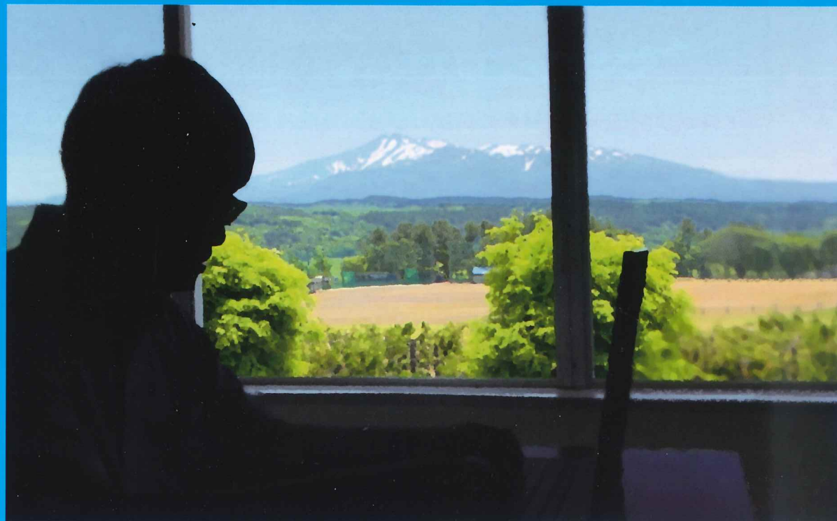
情報メディア科 3年教室から見える景色